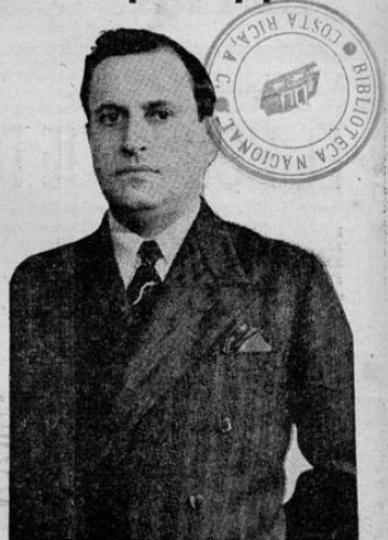
Doctor RAFAEL A. CALDERON GUARDIA

conciencia de gobernante, que presidir esta fiesta, que glorifica y exalta el recuerdo de nuestra independencia. Es el voto popular libremente emitido, sin mixtificaciones ni complicaciones, el que discierne en Costa Rica el honor de la más alta magistratura del Estado; es por ello mismo, del viento fecundo de la democracia, de donde emerge la autoridad de que estoy investido; y para celebrar (Pasa a la Pág. CUATRO)